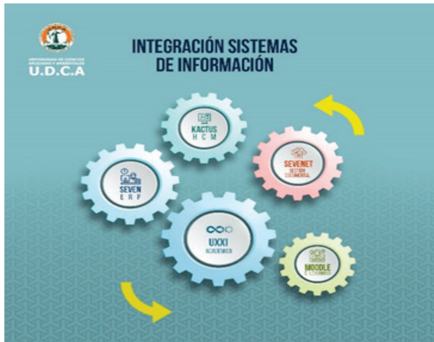
Figura 2. Principales sistemas de información integrados en la Universidad de Ciencias Aplicadas y Ambientales. Esquema elaborado por la Gestión de Tecnologías de la Información y la Comunicación.

La U.D.C.A tiene como aliado estratégico a esta reconocida empresa europea, líder en soluciones tecnológicas, que viene implementando los módulos de este sistema de información con gran éxito, permitiéndole agilizar y optimizar la labor que adelantan los macroprocesos de Formación, de Extensión y Proyección Social, así como de Investigación y Gestión del Conocimiento, puestos al servicio de directivos, de profesores y de estudiantes, mediante el procesamiento y la disposición de la información, lo que permite la moderna gestión académica, administrativa y la oportuna toma de decisiones. UNIVERSITAS XXI incorpora herramientas para la difusión y el análisis de la información gestionada y herramientas para la integración con otros sistemas de gestión, como los que, actualmente, se tienen con el sistema financiero SEVEN y el sistema de Recursos humanos Kactus, desarrollados por la empresa Digital