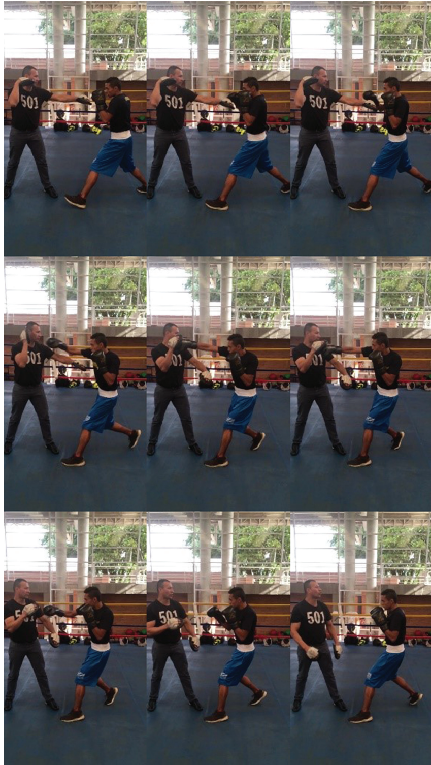
Figura 2. Golpe Recto en Boxeo.