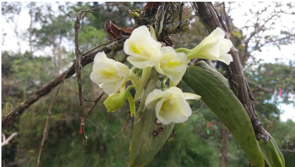
Figura 1. Rodriguezia granadensis , fenotipo de flores blancas, en el sitio del estudio.

Las plantas de R. granadensis , se encontraron creciendo sobre árboles de guayaba ( P. guajava L.), como forofitos, que concuerda con los resultados obtenidos en la investigación de Ventre-Lespiauq et al. (2017), realizada en un parque natural de bosque tropical andino y de Arévalo et al. (2011), en las epífitas de ramita Hirtzia escobarii y Rodriguezia lehmannii , en Cundinamarca y Risaralda,