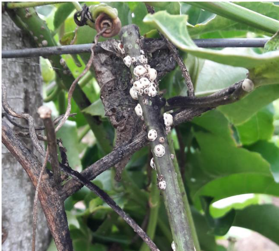
Figura 2. Presencia de poblaciones de Ceroplastes cirripediformis en tallos de maracuyá Passiflora edulis fo. Flavicarpa .

Lo anteriormente descrito, coincide con los resultados reportados por Uriás-Lopez et al. (2010), quienes indicaron que poblaciones de Aulacaspis tubercularis Newstead en huertos comerciales de mango, disminuyó en julio y agosto, donde el factor precipitación osciló de 316 a 459 mm, lo que produjo un descenso drástico de las poblaciones del insecto.