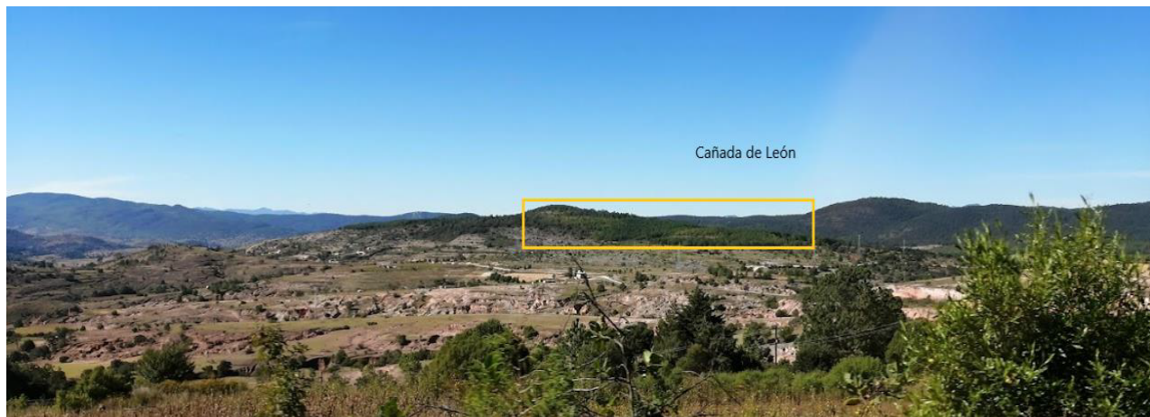
Figura 2. Erosión y reforestación en Cañada de León en San Juan Teposcolula – Oaxaca, México. Vista panorámica del 2022, donde se aprecian las cárcavas y la reforestación en el paraje “Cañada de León”, el arbolado tiene una edad de 11 años.

para el hombre y en sus formas de uso (Sauer, 2006). Valdés Tejera (2018) explica que en las referencias del habitante local se entiende la percepción y la experiencia del que ha sido día a día su espacio, su lugar de trabajo, de ocio, de recuerdos, de experiencias positivas y negativas. Lo que connota que, en el paisaje, el humano no solo se involucra en el objeto, sino que forma parte de él ( ibid. )