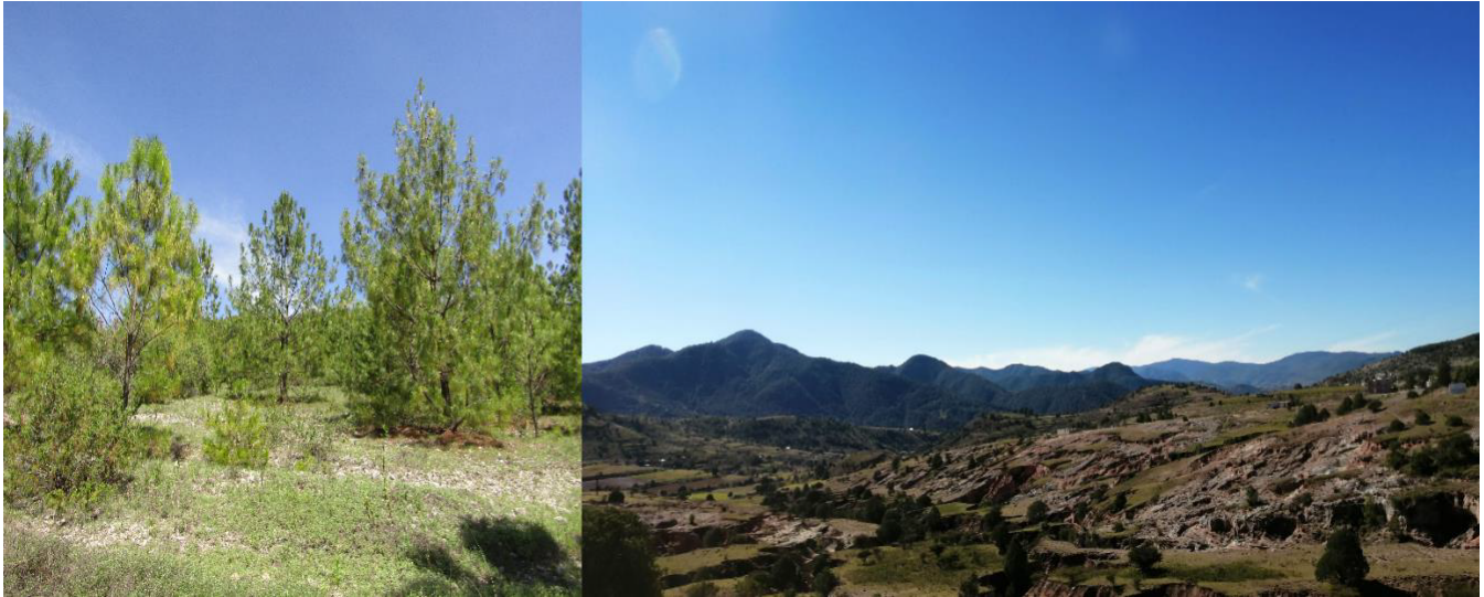
Figura 4. Paisaje de San Juan Teposcolula – Oaxaca, México. En la fotografía del lado izquierdo, se aprecia la vegetación asociada con las reforestaciones y la cobertura de las acículas de los pinos en el 2020 y en la fotografía del lado derecho, el paisaje de la Desviación Diji nuu en San Juan Teposcolula, Oaxaca, en el 2021.

“La tierra reforestada ya no está como antes, ya hay pájaros, ardillas y ya no está erosionada como antes, aunque pasen los aguaceros, ya no deja esas zanjas (cárcavas por erosión hídrica). Ya no hay zanjas como antes, ahora las cubren la yujía y las ramitas que les vamos tirando intencionalmente, para que se vayan rellenando” [sic].