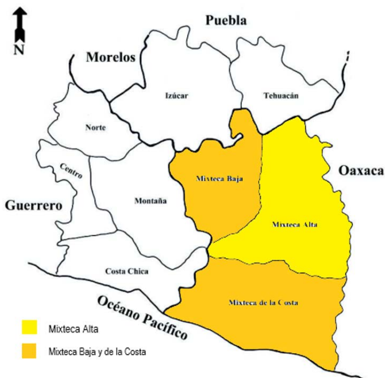
Figura 1. Región de la Mixteca y sus subdivisiones en el estado de Oaxaca. Tomado de Rodríguez (2016).

La región de la Mixteca en el estado de Oaxaca, México, está subdividida en tres regiones (Mixteca Alta, Mixteca Baja y Mixteca de la Costa) (Figura 1). Este estudio, se ubica en la región de la Mixteca Alta, localizada al oeste del estado de Oaxaca. Su paisaje peculiar está caracterizado por la presencia de montañas, cerros, riscos y peñascos, cuyas alturas van entre los 1.650 y 2.500 metros sobre el nivel del mar (Pérez Ortiz, 2017). Su orografía y el desarrollo de actividades antropogénicas favorecen la erosión del suelo, lo que derivó en el deterioro ecosistémico (Guerrero-Arenas et al. 2010).