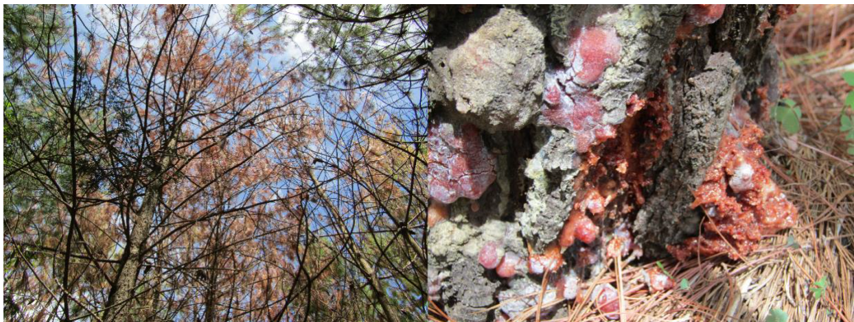
Figura 5. Plaga en área reforestada en San Juan Teposcolula. En la fotografía del lado izquierdo, se muestra parte del arbolado sin mantenimiento forestal y árboles muertos. En el lado derecho, el cuello del fuste afectado por escarabajo descortezador en San Juan Teposcolula, Oaxaca, en el 2019.

“ Nos da la satisfacción de verlos crecer, da la satisfacción de la materia orgánica, un poco de abono, oxígeno y uno que otro árbol que nos sirve, porque la plaga definitivamente nos los está acabando ” [sic].